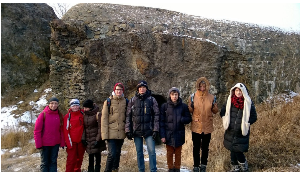
У форта №5

неприступной в мире! Но для чего была возведена столь легендарная конструкция? Ведь действительно крупных атак на наш город никогда не было. И почему была заброшена крепость? Чем больше я узнавала о