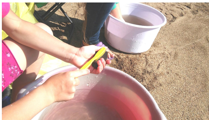
Рабочий процесс: чистка керамики

Бохай неоднократно пытался вступить в более чем дипломатические и торговые отношения с Японией. Даже был совмест-