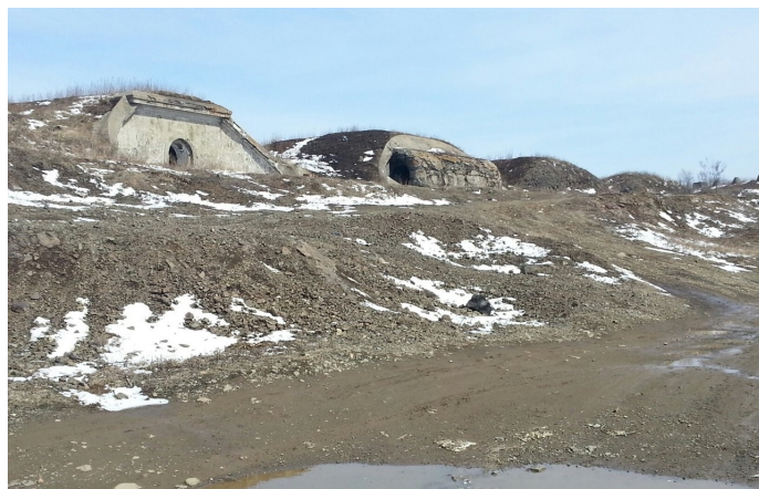
Форт Суворова в зимний период