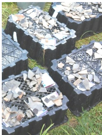
Керамические находки. Чаще всего попадают осколки посуды

самым значимым в его истории. Случилась первая крупно-масштабная экспедиция в село Краскино. От кружка поехала «Могучая кучка», состоящая из 4 человек, включая руководителя. Еха-