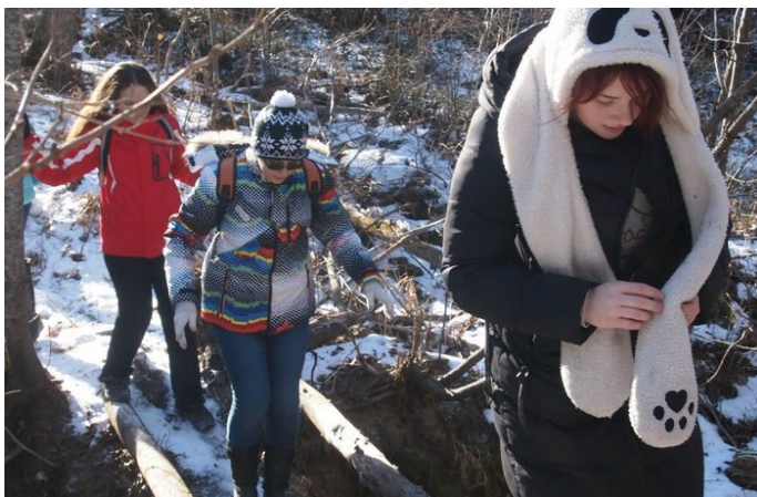
«Суровый Мужской Поход»