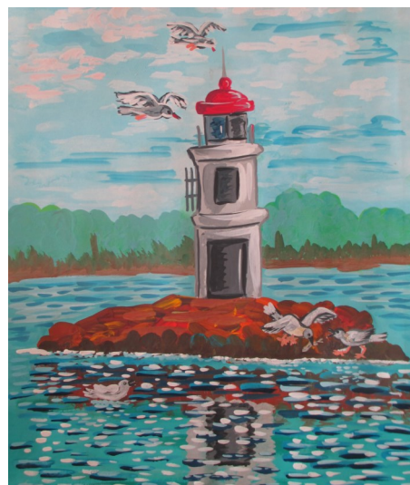
Лаура Голубева, 7К