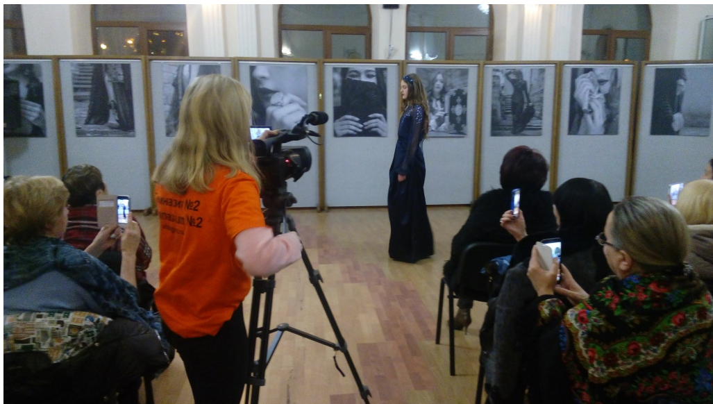
Ребята из школьного телевидения G2tv за съемкой документального фильма о выставке

Эльмира Расулова, 9А фото Данила Таранова, 11М