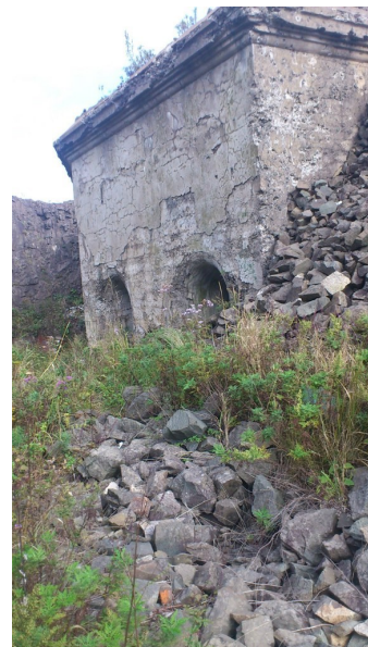
Форт Суворова в летний период