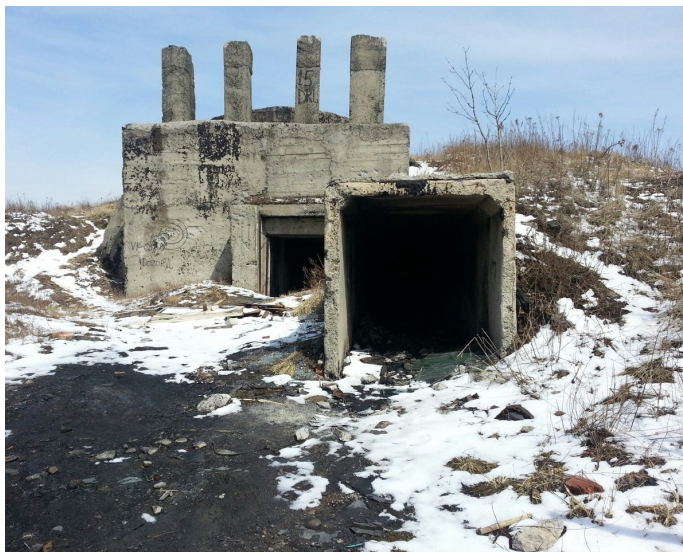
Царская электростанция на форт Суворова

Историческая справка: строился в 1899-1904 годах; изначально именовался форт № IV, позднее стал именоваться фортом № II. В 1903 года получил наименование «форт Князя Суворова». В 30-50-е годы XX века форт был перестроен и приспособлен под командный пункт.