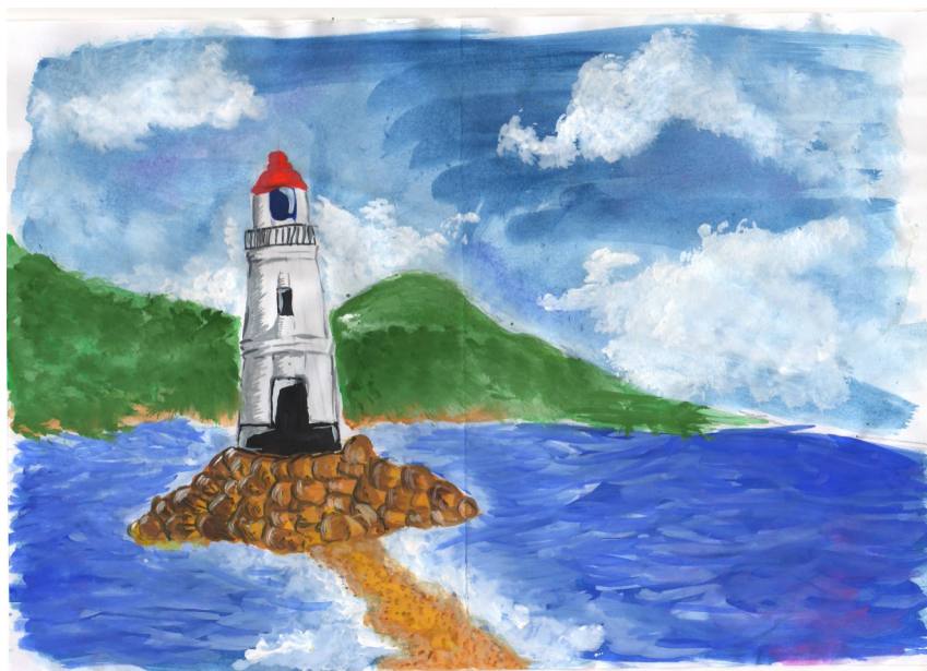
Рисунок Софьи Поляковой, 9А